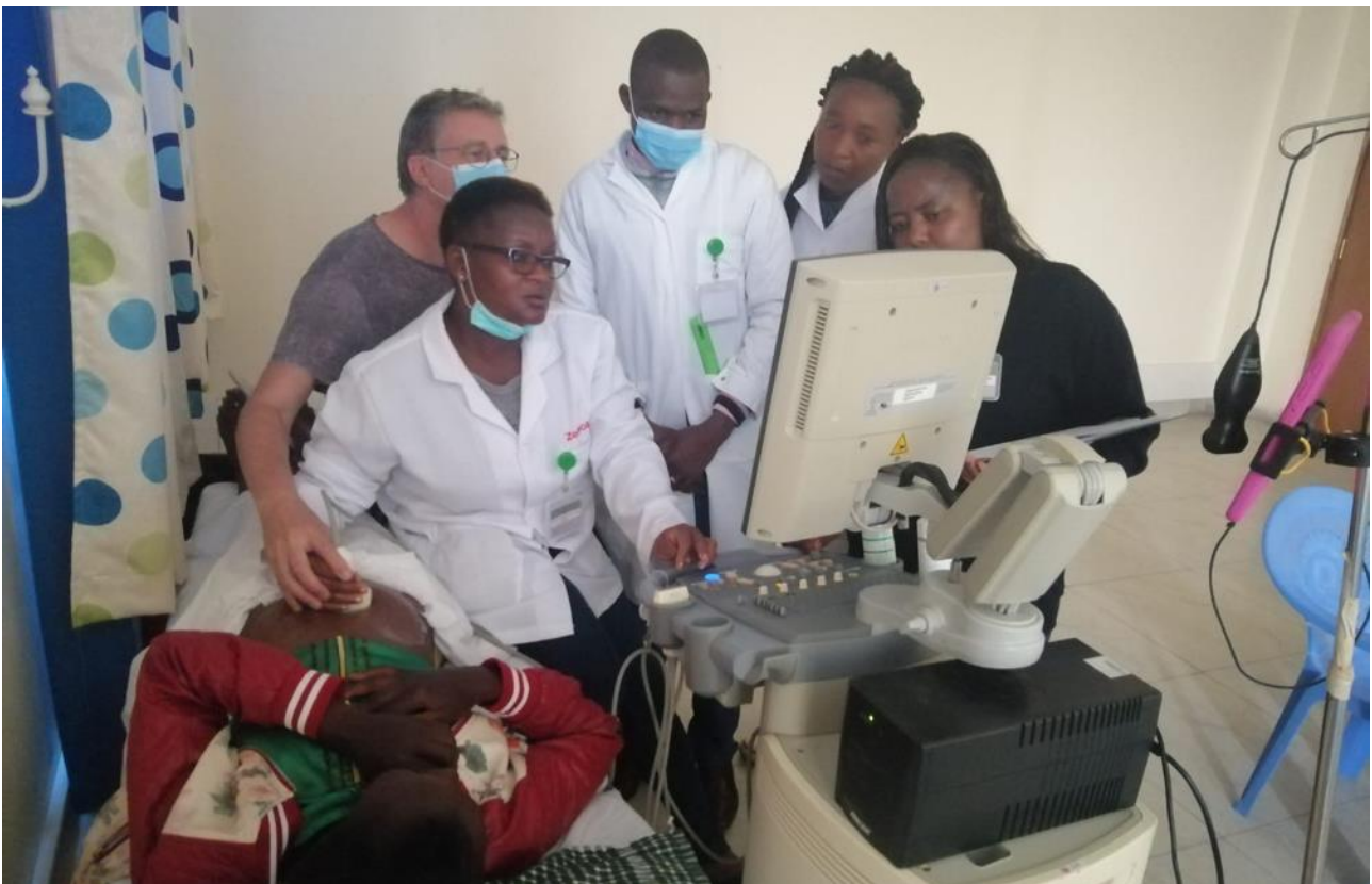
Praktisches Training in Kleingruppe