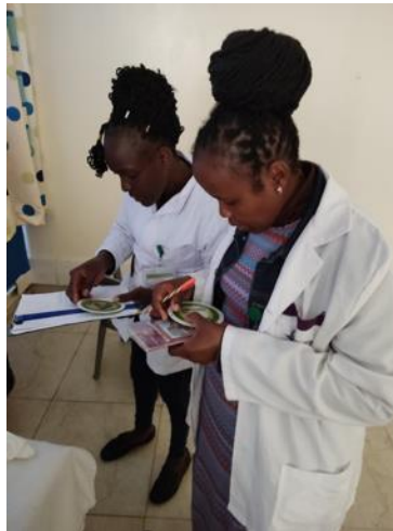
Umgang mit Schwangerschaftsscheibe