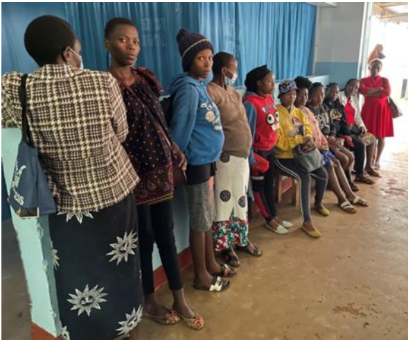
Der „Gratis“ Ultraschall wurde gerne aufgenommen: Warteschlange

Aufgrund der vielen Prüfungskandidaten haben wir den letzten Kurstag ganz den Prüfungen gewidmet und die letzte Präsentation auf den Vorabend vorverschoben.